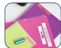
Stampa etichette con ampiezze da 3,5 a 18 mm

Questa etichettatrice ad alte prestazioni è il partner ideale negli ambienti professionali per l'organizzazione e la chiara identificazione di importanti materiali e articoli.