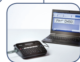
Stampa etichette da PC o Mac