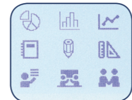
14 font / 99 cornici Più di 600 simboli