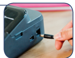
Utilizza 6 batterie* AA o adattatore AC (incluso)