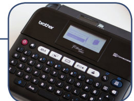
Disegni di etichette modificabili inclusi