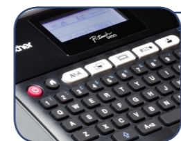
Semplice tastiera stile PC