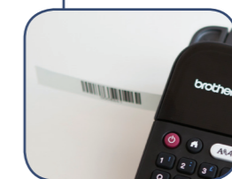
Stampa codici a barre