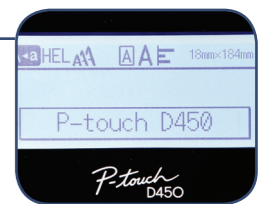
Display grafico retroilluminato ad alta risoluzione